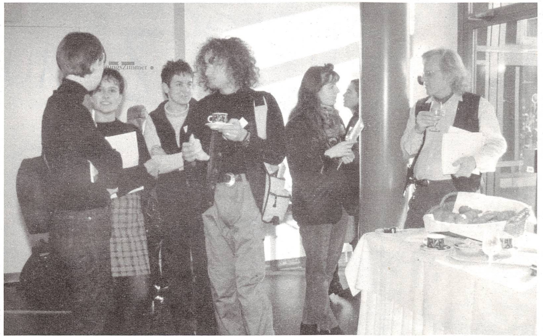
Im Taubblindenwesen wird eine bessere Zusammenarbeit gesucht und der Austausch über die Grenzen der eigenen Institution hinaus.

Sie könnten auch nötige Informationen für die taubblinden Menschen beschaffen. Im Weiteren denkt man an die vermehrte Nutzung neuer technologischer Möglichkeiten.