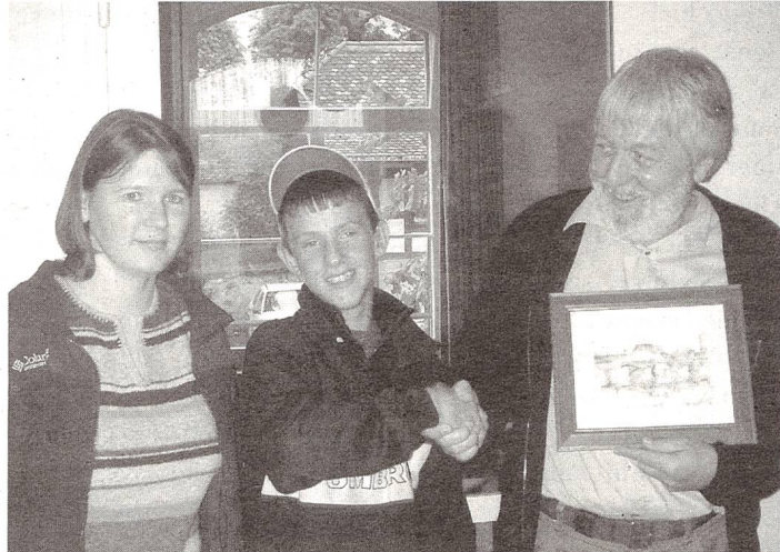
Eine gehörlose Lehrerin und ein Schüler überreichen das Bild ihrer Schule

Nach der Zehnminutenpause begaben wir uns wieder in den Speisesaal. Dort teilten wir den Besuch in Gruppen auf, welche im Anschluss von den verschiedenen Gehörlosenklassen zu einem Unterrichtsbesuch abgeholt wurden. Diese Besuche waren sehr interessant und aufschlussreich, da die multikulturelle Vielfalt der Besucher unsere Schüler zu vielen interessanten Fragen und Gesprächen motivierte. So machte beispielsweise die 7. Gehörlosenklasse Interviews für die Schülerzeitung der Sprachheilschu-