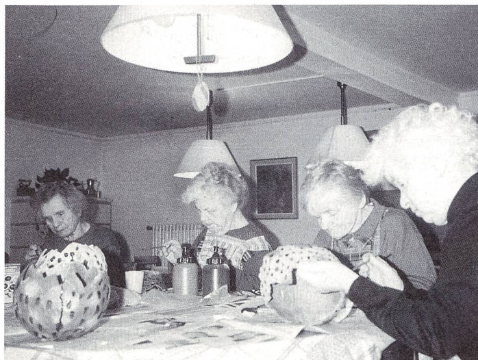
Hübsche Bastelarbeiten entstehen.