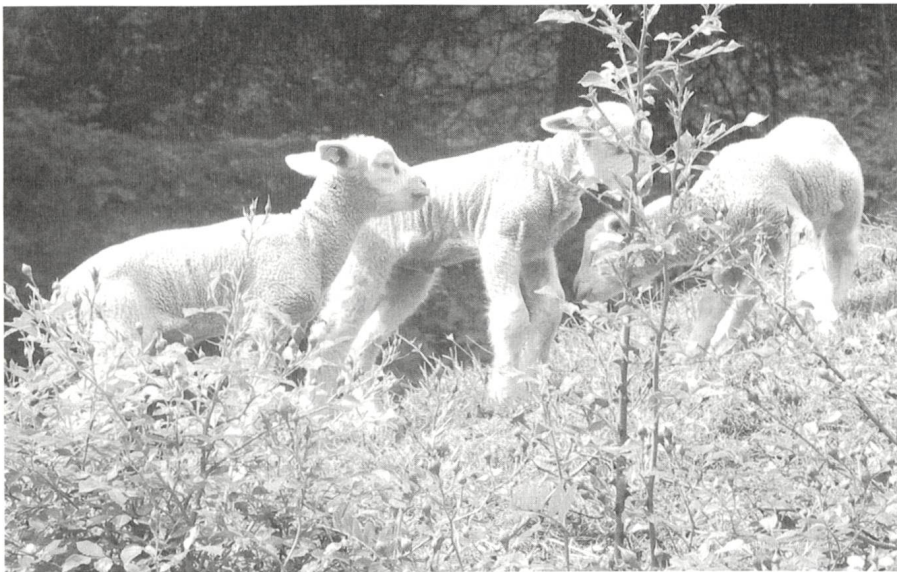
Auch den Schafen gefällt's in Passugg

Während dem Pressetag spürte man die Freude am Erreichten aber auch den Willen und die Initiative, Neues anzupacken. Man spürte und sah vor allem auch, dass der Wille Berge versetzen kann. Die herzliche Gastfreundschaft und die überaus sympathische, bescheidene und informative Präsentation der Bildungsstätte für Gehörlose, Schwerhörige und Ertaubte hinterliess zu Recht einen starken Eindruck.