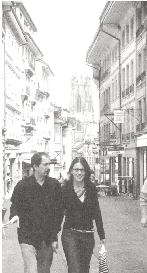
Dieses Jahr war Fribourg Schauplatz der GV der Genossenschaft Hörgeschädigten-Elektronik (GHE)

geordneten Arbeitsstruktur. Ohne Computer lässt sich der Einsatz von über 30 GebärdensprachdolmetscherInnen mit jährlich insgesamt 5200 Einsätzen nicht steuern. Diese hohe Einsatzzahl kommt einer Steigerung von 25 Prozent gegenüber dem Vorjahr gleich. Aufgrund der ersten Erfahrungen wurde auch der Gesamtarbeitsvertrag mit einer Arbeitsgruppe des Berufsverbandes der Gebärdensprachdolmetscher (bgd) und dem vpod abgeschlossen.