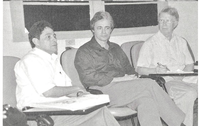
Bilder von oben:

Tasche als Geschenk an allen TeilnehmerInnen