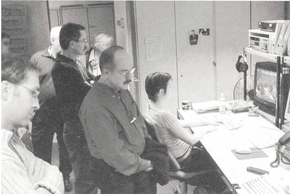
Während der Tagesschau wird es hektisch