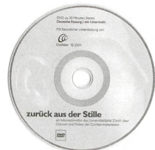
DVD «zurück aus der Stille»

Cochlear AG, Marketing und Customer Service, Margaretherstr. 47, 4053 Basel