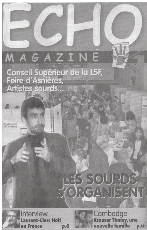
Echo Magazine erscheint seit 60 Jahren im A4-Format.