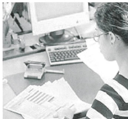
Büro in der Stiftung ESPAS: Arbeit fördert die Selbständigkeit und die Teilhabe am gesellschaftlichen Leben