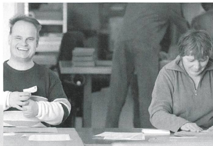
psychisch Kranke werden von der Stiftung ESPAS auf die Rückkehr in den Arbeitsmarkt vorbereitet

Die Eingliederungsstätte Brunau legte 1982 den Grundstein für die heutige ESPAS. Seit 1994 tritt ESPAS als eigenständige Stiftung auf. Aufträge von Unternehmen, Privatpersonen, Vereinen und Organisationen ermöglichen es, interne und externe Integrationsarbeitsplätze in Zürich, Richterswil und Winterthur anzubieten. ESPAS-Teams erledigen beispielsweise die Administration oder die Buchhaltung von Kunden, führen ihren Telefonservice oder übernehmen Lager-, Ausrüst- und Versandarbeiten.