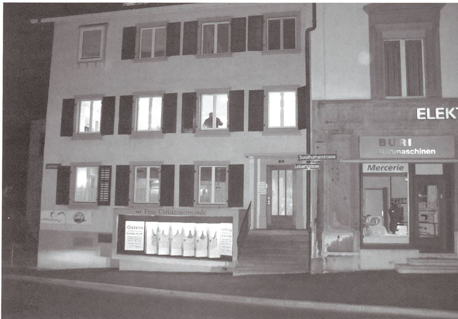
Die Fachstelle im 1. Stock in Olten an der Leberngasse 2

Die Vision wird Realität. Am Montag, 31. März 2008, ist die Eröffnung der Bürogemeinschaft zwischen der Regionalstelle des SGB-FSS Nordwestschweiz und den Beratungs- und Fachstellen für Gehörlose und Hörbehinderte von Basel, Bern, Luzern und Zürich. An bester zentraler Lage und verkehrstechnisch optimal