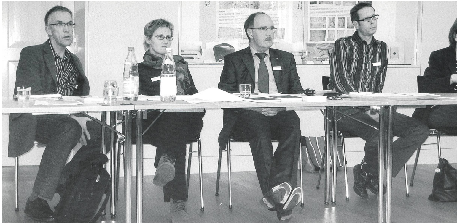
Die rund 30 Tagungsteilnehmenden in der Diskussion und beim interdisziplinären Austausch.

der Umgebung öffnen. In diesem Fall konnte durch das Kommunikationssystem PECS (Picture Exchange Communication System) ein gegenseitiger Austausch erreicht werden. Eine frühzeitige Suche nach Alternativen zum Lautspracherwerb könnte deshalb bei Kindern mit autistischen Zügen lohnenswert sein. Falls das Kind das Tragen des CI zeitweise ablehnt (in diesem Fall: nach eines Defekts, nach den Ferien), kann sich durchaus Beharrlichkeit lohnen - dieses Kind wurde nicht zum Non-User. Schwierigkeiten entstehen bei Kindern mit autistischen Zügen auch bei der CI-Anpassung, da kein Blickkontakt möglich ist. Weiterhin wurde zur Diskussion gestellt, ob der Sprachprozessor mehr auf die Wahrnehmung von Geräuschen hin kodiert werden sollte, um diesen Nutzen für Kinder mit autistischen Zügen noch besser zu ermöglichen, da die sprachliche Kommunikation für diese Kinder auch ohne Hörbeeinträchtigung deutlich eingeschränkt ist.