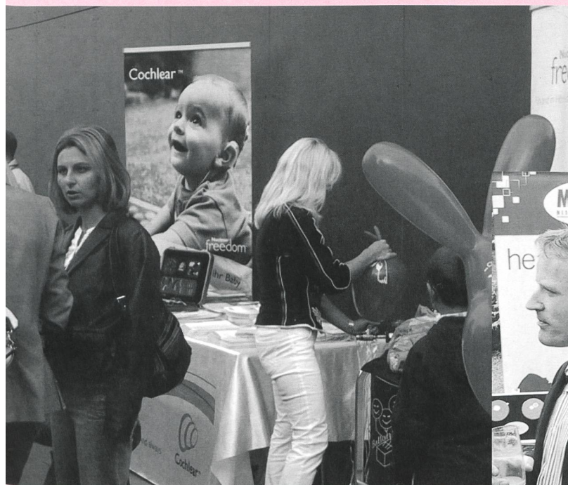
Informationsstand der Firma Cochlear, die neben der Firma Med-EL mit dem CI-Zentrum Luzern zusammen arbeitet.