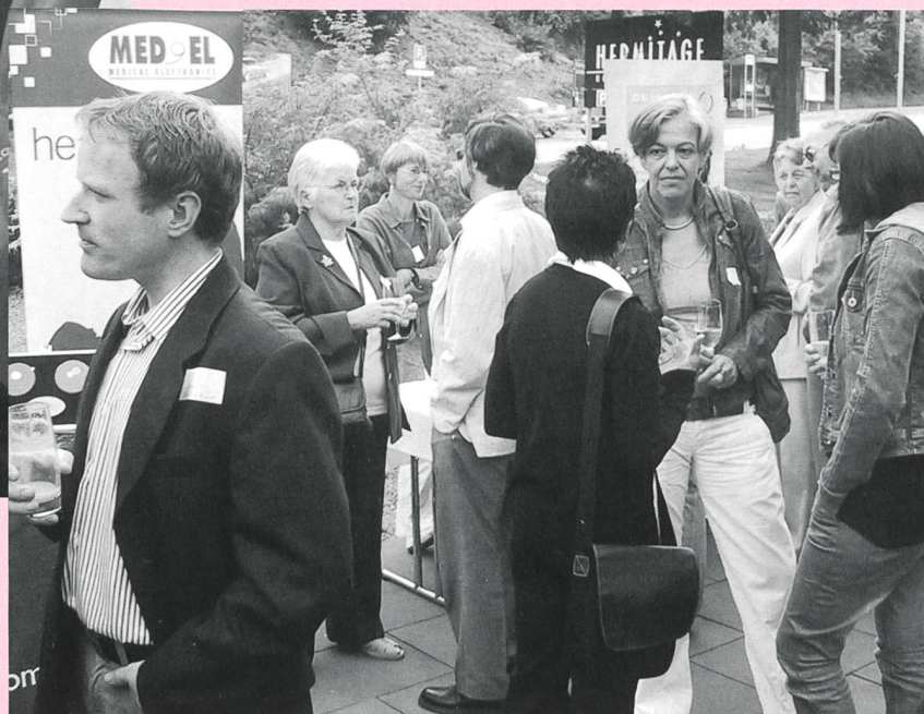
Angeregte Diskussionen unter den Besucherinnen und Besuchern des CI-Festes.