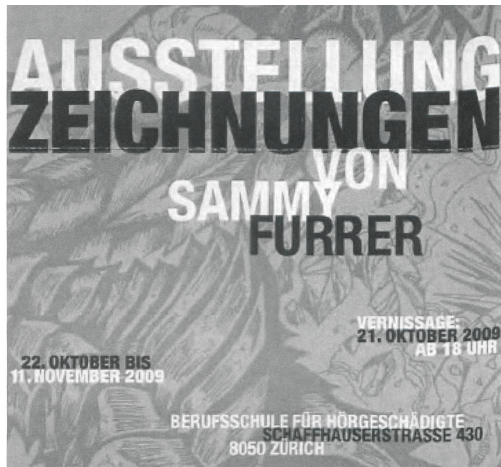
Ein Besuch der Ausstellung lohnt sich bestimmt.