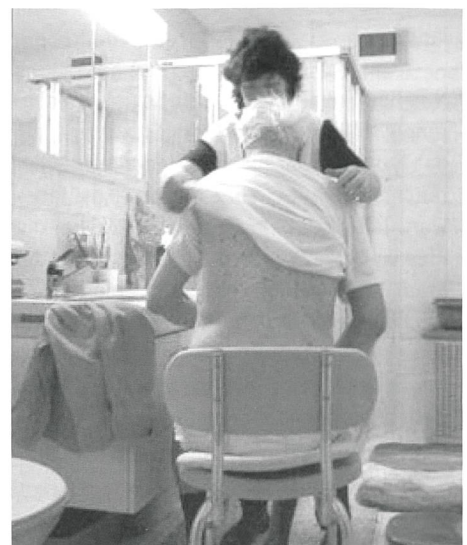
Hilfe beim Waschen gehört zu den Dienstleistungen.

7 von 10 Betagten benötigen weniger als acht Stunden Unterstützung pro Woche, um weiterhin einigermaßen autonom leben zu können. Mit Abstand am meisten Dienstleistungen werden tagsüber gebraucht, deutlich weniger morgens, abends und in der Nacht.