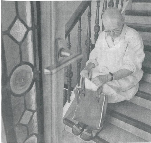
Wer Hilfe beim täglichen Einkauf bringt, soll vermehrt auf die Unterstützung rüstiger Rentner zählen können.

Zuerst war es eine Idee von Pascal Couchepin. Mittlerweile ist es ein Projekt, das bald schon in der Praxis getestet werden soll: Eine Börse mit Zeitgutschriften für die Betreuung älterer Menschen.