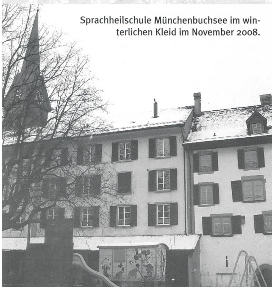
Sprachheilschule Münchenbuchsee im winterlichen Kleid im November 2008.

Aktuell besuchen 24 gehörlose und schwerhörige Kinder die kantonale Sprachheilschule Münchenbuchsee. 350 Kinder in Regelklassen werden durch den Audiopädagogischen Dienst betreut. 88% davon sind leicht bis mittelgradig schwerhörig und 12% sind resthörig, d.h. hochgradig schwerhörig.