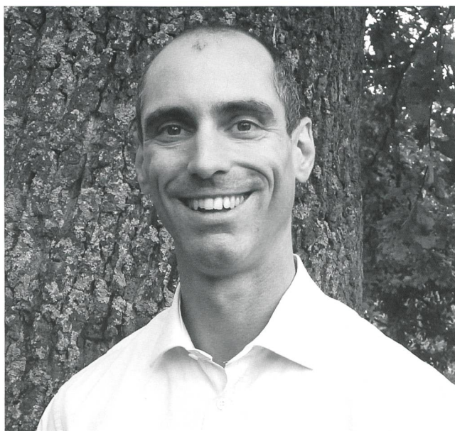
Ein entspannter und gelöster Referent in der wohlverdienten Kaffeepause.