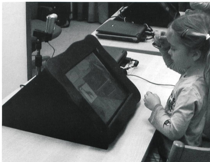
Kind beim computergestützten Gebärdentraining