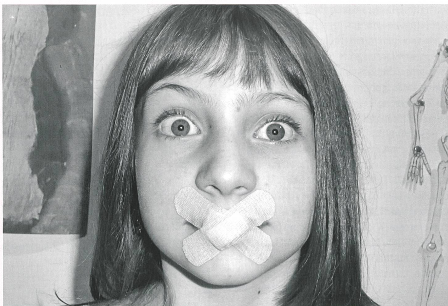
Erzwingenes Schweigen ist die stärkste Waffe der Täter.

Die Aussagen von Gewaltbetroffenen werden immer wieder in Zweifel gezogen. Dies entspricht einer bekannten Täterstrategie und wird als Neutralisierungsstrategie bezeichnet – dieses Verhalten ist nur denkbar weil sich viele Menschen täterloyal verhalten. Jede zweite gehörlose Person erlebt sexualisierte Gewalt (Dietzel 2004). Die Behinderung hat sich dabei als deutlicher Risikofaktor für sexualisierte Gewalt erwiesen. Der Begriff «sexualisierte Gewalt» verdeutlicht, dass sich die Täter des Sexuellen «bedienen», wenn sie ihre Verbrechen begehen – während «sexuell» für einvernehmliche intime Begegnungen steht. Eine klare Wortwahl bringt das Unrecht der Taten zum Ausdruck.