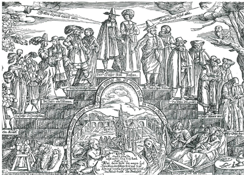
Abraham Bach, Das Zehen-jährige Alter Augsburg um 1660.

Ebenso habe die im Zuge der Moderne entstehende Kernfamilie die Älteren zuerst an den Rand des familialen Aufgabenspektrums, später auch in einer ausserfamiliare und separate Existenzform gedrängt. In Verbindung mit diesem Prozess sei gleichzeitig ein eklatanter und unaufhaltsamer Macht- und Reputationsverfall der Älteren in allen kulturell prägenden Sektoren der Gesellschaft zu bemerken gewesen. Sie verloren die Stellung, Ahnen zu sein, die als Quelle der Werte der Vergangenheit gelten könnten. Daran anschliessend habe die zunehmende Verschriftlichung der Erfahrungen und ihre Weitergabe in einem eigenen institutionalisierten Bildungssystem zu einem Bedeutungsverlust der mündlichen Erzähltraditionen des Alters geführt und damit zusätzlich zu der gesellschaftlichen Stauseinbusse der Älteren beigetragen.