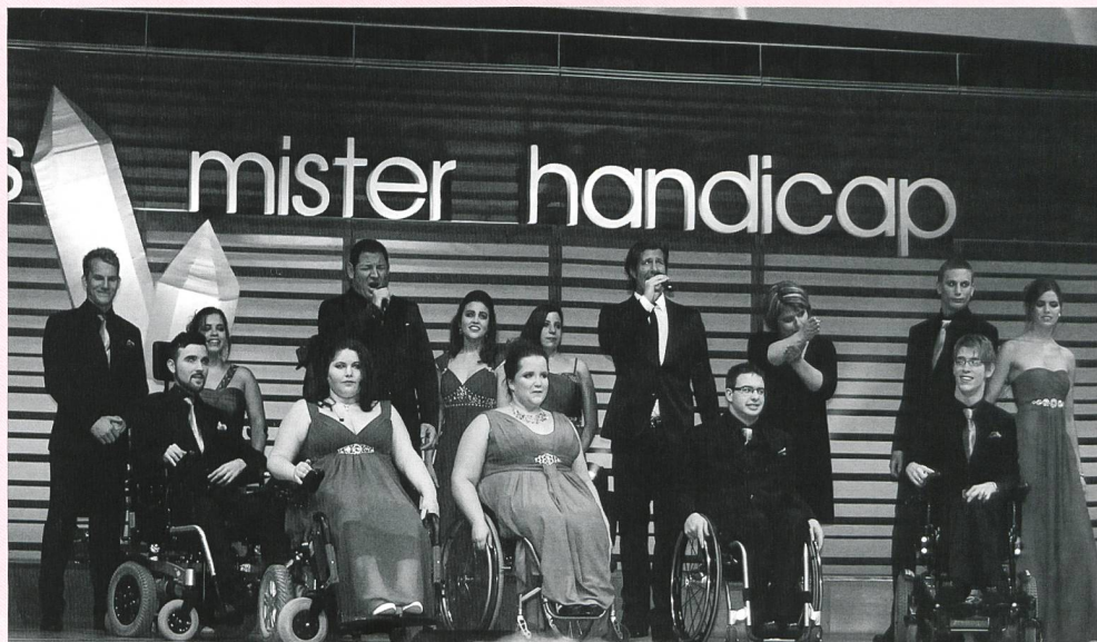
Grandiose Stimmung bei den Kandidatinnen und Kandidaten und beim Publikum im KKL.