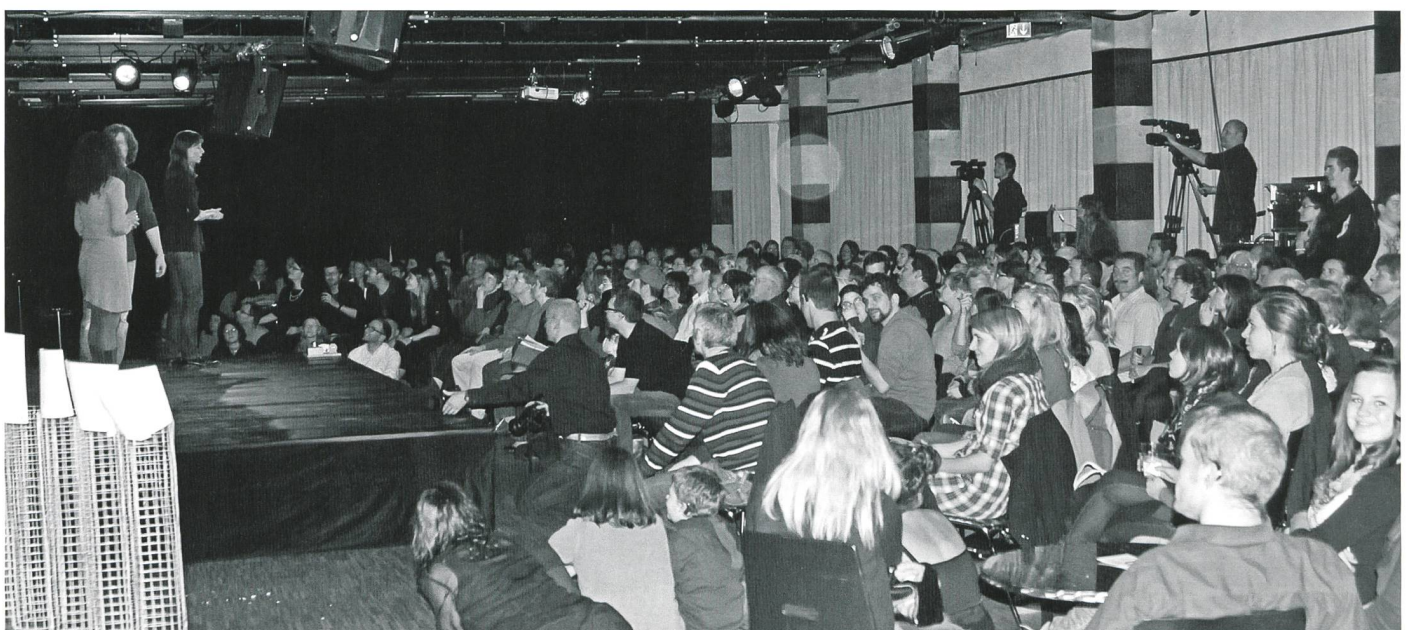
Das gehörlose und hörende Publikum ist über die Darbietungen der Slam-Poeten» restlos begeistert. Ein Event, der zwei Kulturen verbindet.