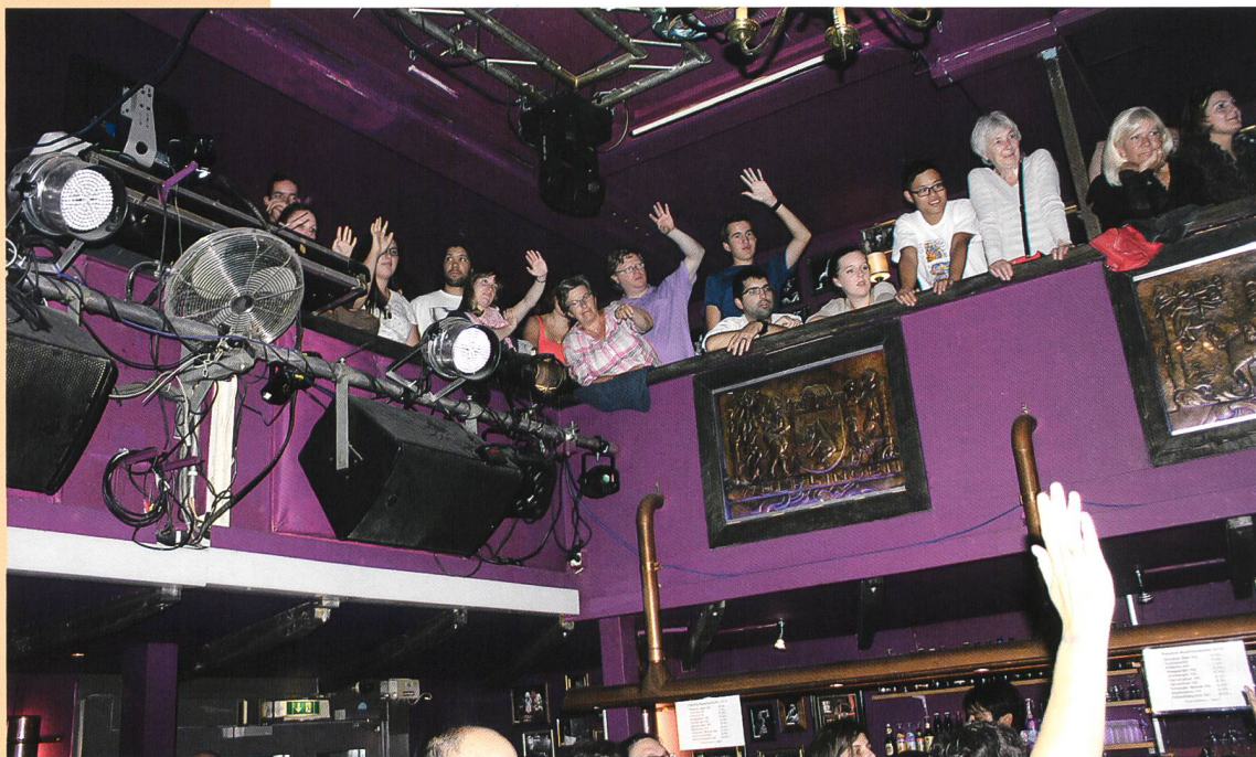
Ein toller Event, der noch lange in sehr guter Erinnerung bleiben wird.