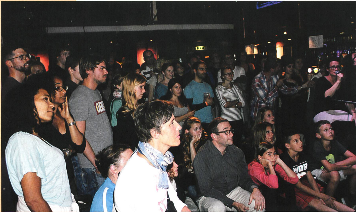
Das Publikum ist von den Darbietungen der acht Slammer total begeistert.