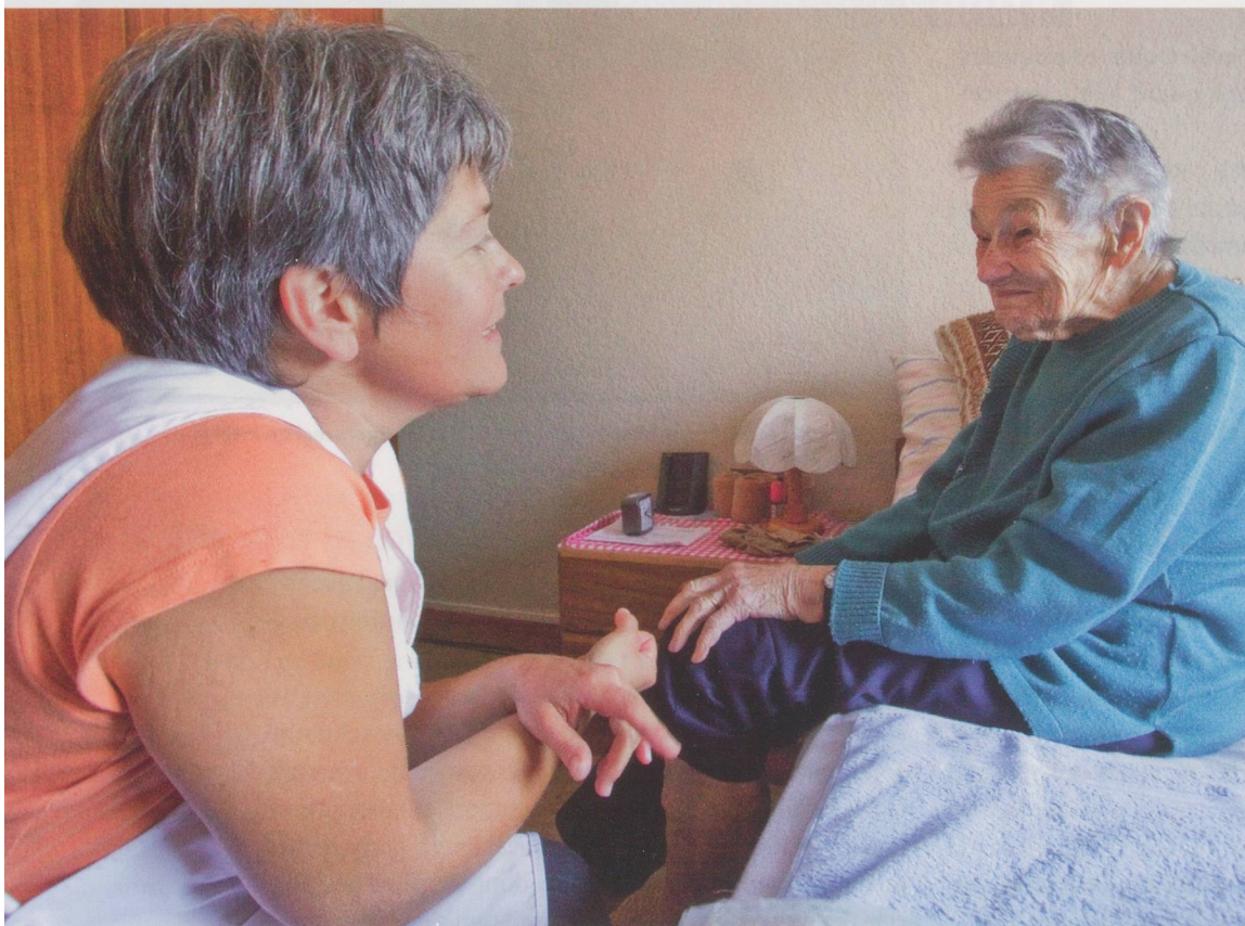
La mise en œuvre du nouveau régime de financement présente des lacunes – parfois au détriment de ceux qui reçoivent des soins à domicile.

Le nouveau régime de financement des soins, en vigueur depuis plus de quatre ans, est mis en œuvre de manière très variable selon les cantons. La nécessité d'y apporter des améliorations apparaît de plus en plus.