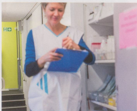
Une collaboratrice de l'ASSASD au travail

Le vieillissement de la société et la volonté des seniors de rester chez eux le plus longtemps possible place les organisations d'aide et de soins à domicile face à un défi herculéen. Pour se mettre au service de toutes les générations, celles-ci investissent dans leur personnel et concluent des partenariats, notamment avec Cosanum, le logisticien suisse au service de la santé.