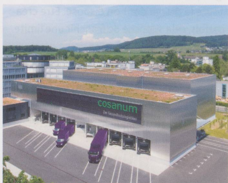
Le centre de compétence pour nos partenaires