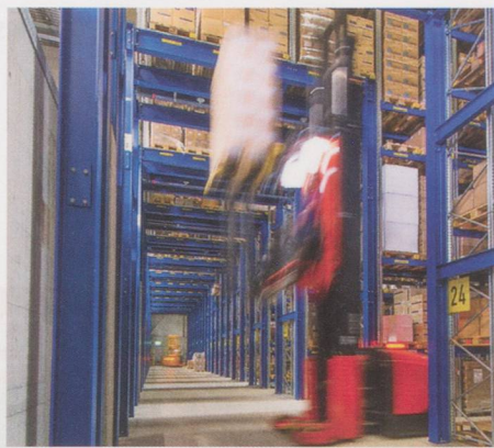
Entrepôt à étagères élevées, avec 6500 emplacements pour palettes