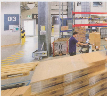
Zone de réception de la marchandise au centre logistique à Schlieren