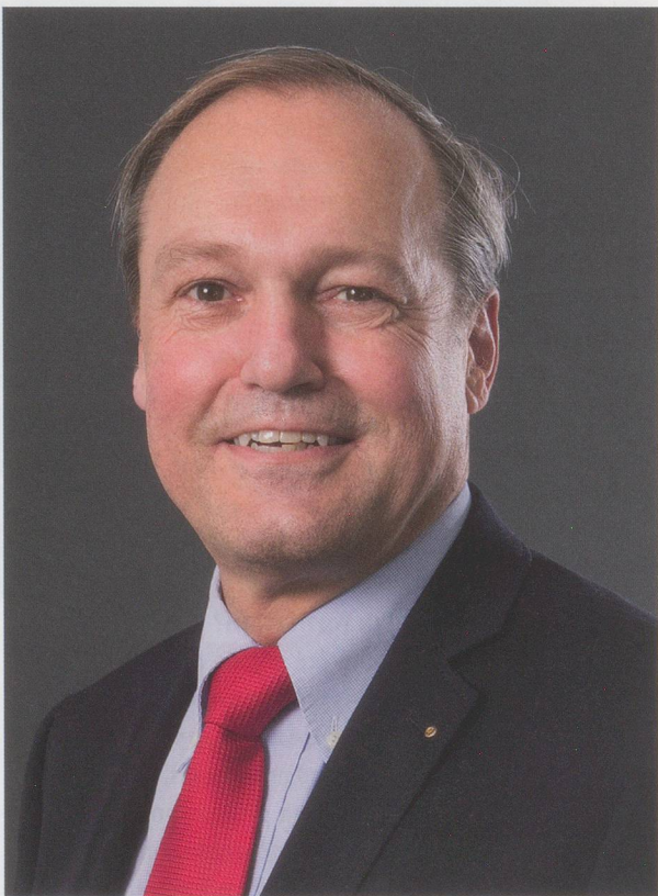
«Dans le domaine des soins, «efficacité» ne doit plus être considéré comme un gros mot», dit le maire de Gossau, Jörg Kündig.

Les services de soins à domicile d'utilité publique sont les seuls capables de garantir les soins de base nécessaires. C'est Jörg Kündig, membre du parti libéral-radical (PLR) et président de l'association des maires du canton de Zurich, qui le dit. Selon lui, avec la pression exercée par l'augmentation des coûts de la santé, la concurrence se profile davantage – et les organisations à but non lucratif doivent s'armer pour le futur.