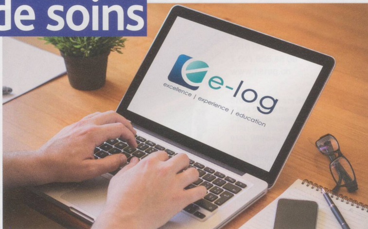
E-log aide à établir les compétences professionnelles.

red. La formation continue fait partie depuis longtemps des professions de soins. La plate-forme en ligne e-log aide à établir les compétences professionnelles rapidement et avec précision. Les professionnels des soins peuvent documenter leurs activités de formation continue dans leur portfolio e-log et ainsi compléter en tout temps les étapes de leur carrière. Depuis mi-mars, plus de 1000 personnes se sont enregistrées sur e-log.ch pour profiter de l'offre de cette plate-forme en ligne encourageant le développement professionnel. Après la création du profil, l'utilisateur peut télécharger ses diplômes et certificats de travail pour tenir à jour son curriculum vitae. L'agenda contient des offres de formation continue de la branche. Chaque formation continue donne droit à des points log. Un point log correspond à 60 minutes de performance éducative. L'Association suisse des infirmières et infirmiers (ASI), la Fédération suisse des infirmières et infirmiers anesthésistes (FSIA) et Curacasa, l'association suisse des infirmières indépendantes, ont élaboré des recommandations du nombre minimal d'heures que le personnel soignant devrait consacrer à sa formation