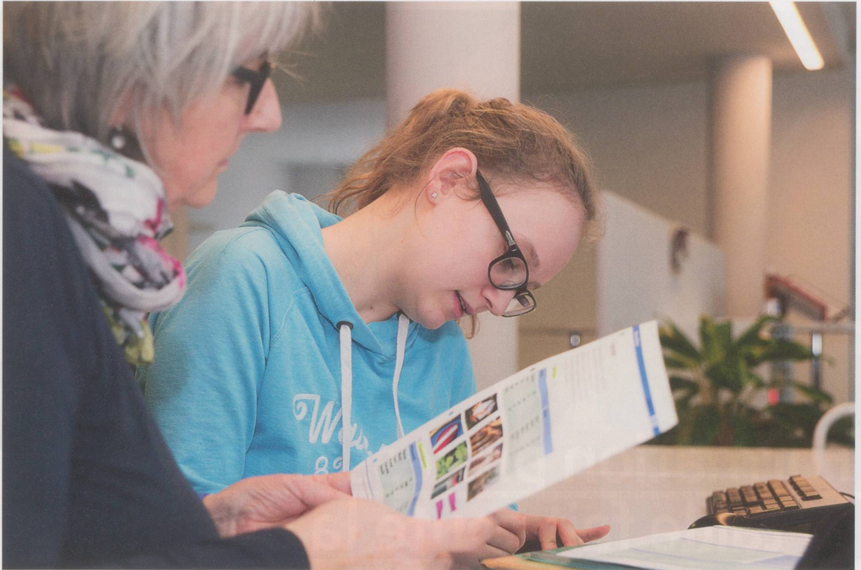
Le «modèle lucernois» fonctionne et crée de l'offre supplémentaire dans le canton.

tions de Spitex et des EMS par les communes. Le modèle se réfère au rapport sur les besoins en effectifs jusqu'en 2020 édité par la Conférence suisse des directrices et directeurs cantonaux de la santé (CDS). Pour Spitex et les EMS, ces chiffres ont été convertis afin de définir la valeur désirée pour 2020. D'après ces calculs, le secteur du maintien à domicile doit offrir annuellement 69 places de formation pour des professionnels des soins ES et HES, dans le Canton, ainsi que 105 places pour des apprentis ASSC. Le nombre de places à créer par chaque établissement dépend des heures de soins OPAS fournies: sur la base des heures de soins OPAS fournies l'année précédente, chaque organisation peut calculer combien de personnes elle doit former par année. Si elle ne forme pas le nombre requis, elle est frappée d'un malus. Dans le cas contraire, elle est créditée d'un bonus. La formation crée des emplois. Un cursus de formation tertiaire demande l'engagement d'une personne responsable de la formation. Cela dépasse clairement les moyens dont disposent les petites structures. C'est alors la personne responsable de la formation au niveau du canton qui s'en chargera. Le groupe de travail cantonal est actuellement en train de réévaluer le modèle. «L'éventualité d'inclure d'autres professions dans le secteur des soins à domicile, est actuellement discutée», précise Tamara Renner.