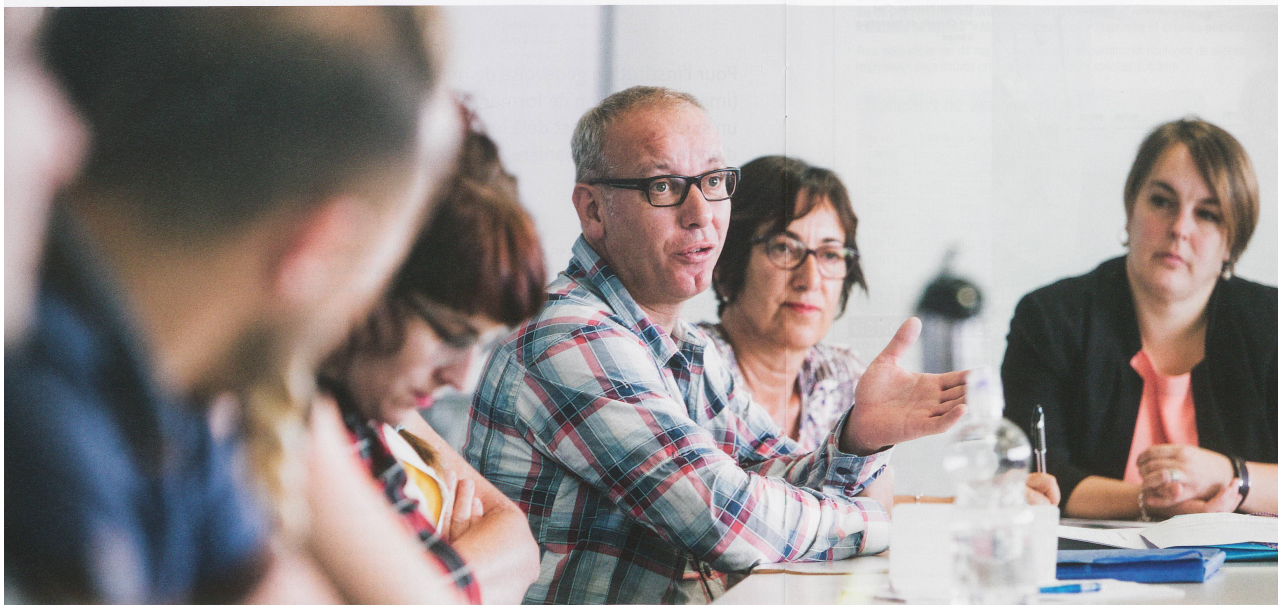
La séance d'accueil des nouveaux collaborateurs imad fait partie des dispositifs de formation et a lieu chaque mois.

Le tout premier de l'association suisse des professionnels de santé (ASPS) a été créé en 1984. Elle est membre de l'Association suisse des professionnels de santé (ASPS) et de l'Association suisse des professionnels de santé (ASPS).