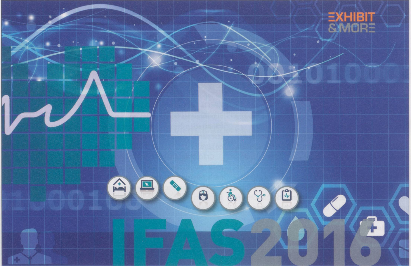
EXHIBIT & MORE