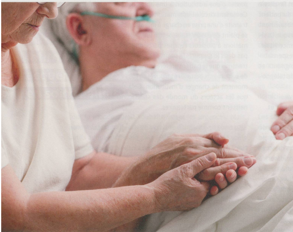
En Suisse romande et au Tessin, les personnes âgées décèdent plus souvent dans une institution qu'en Suisse alémanique.

Pendant cinq ans, 200 scientifiques ont étudié à la loupe la situation des personnes en fin de vie en Suisse. Les résultats montrent que, malgré les techniques médicales et méthodes thérapeutiques modernes, l'encadrement des personnes en fin de vie peut encore être grandement amélioré.