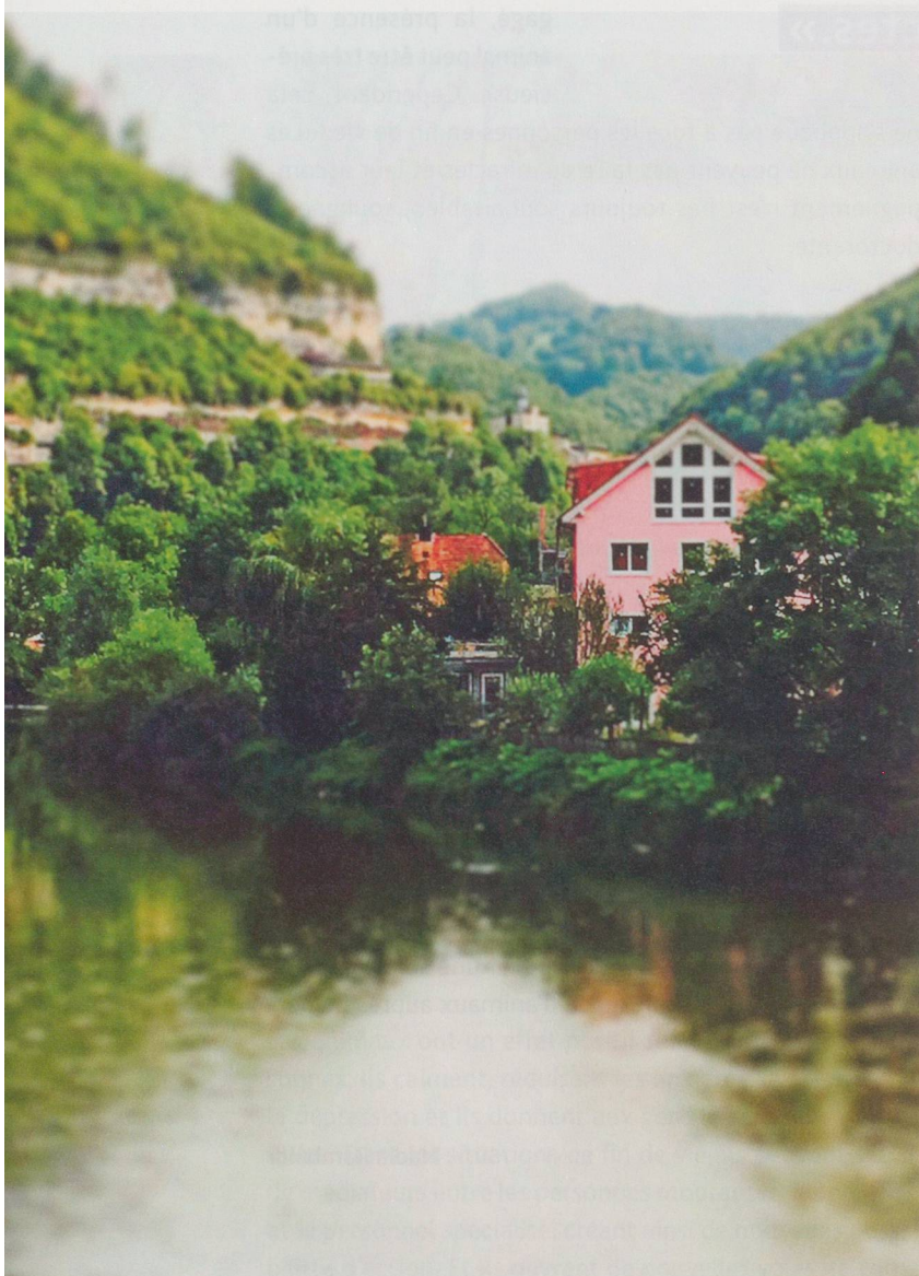
«Au fil du Doubs», maison rose aux volets bleus, a réouvert ses portes pour l'année 2018.

Les rénovations terminées, la maison de vacances «Au fil du Doubs» accueille à nouveau des camps, des familles ou des personnes seules souhaitant venir se ressourcer et reprendre des forces pour faire face à la maladie ou au handicap. Une institution au concept unique en Suisse avec laquelle l'aide et soins à domicile de la région des trois rivières collabore régulièrement pour le bien-être des pensionnaires.