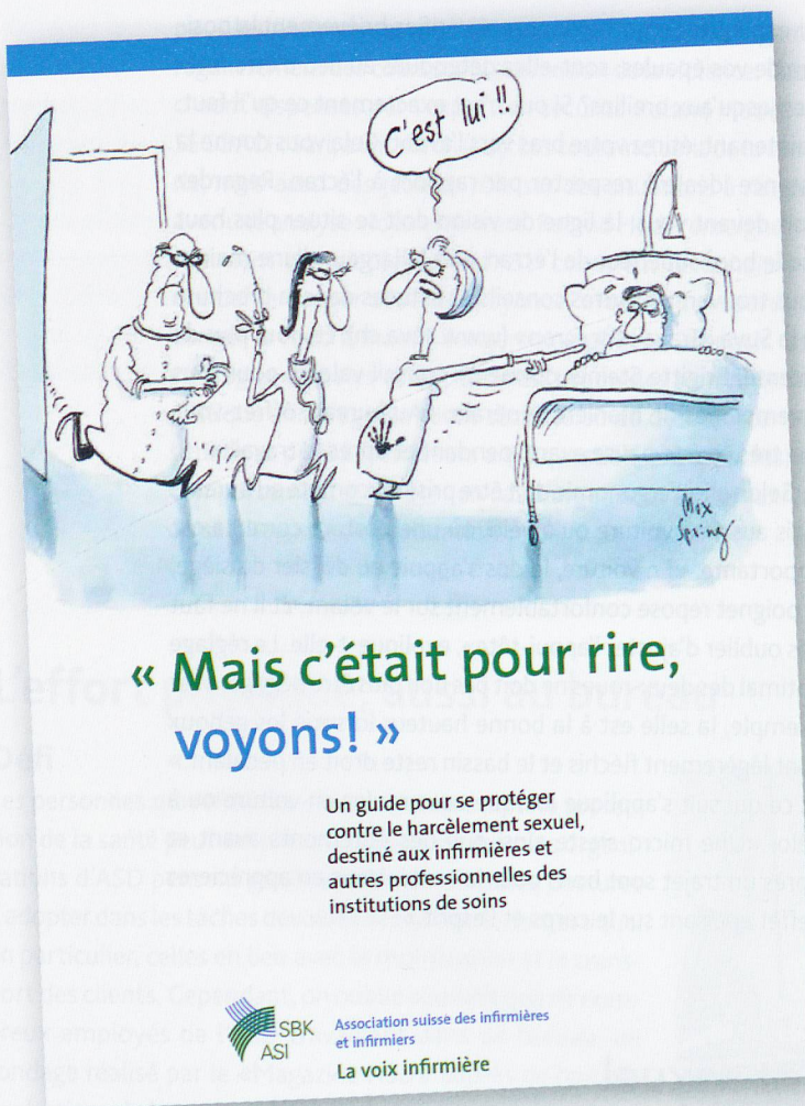
Le guide de l'ASI contre le harcèlement sexuel.

mesures d'aide et de prévention. Face à des situations de mises en danger telles que des agressions, les employés sont incités à prévenir les comportements agressifs des clients au moyen d'un dispositif (alarme, voies de fuite) ainsi qu'à discuter en équipe des problèmes rencontrés et des règles de conduite à adopter.