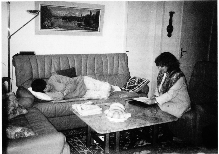
Die Bedarfsklärung wird bald eine obligatorische Dienstleistung der Spitex sein.

Der Bundesrat hat die einheitliche Bedarfsklärung zur obligatorischen Dienstleistung der Spitex erklärt. Eine Arbeitsgruppe des Spitex Verband Schweiz hat verschiedene Instrumente zur Bedarfsklärung geprüft. Hier die Ergebnisse und die daraus abgeleiteten Konsequenzen.