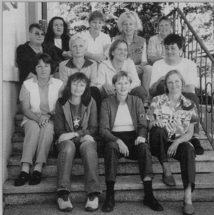
Die Mitarbeiterinnen der Spitex Schwanden Nidfurn-Haslen.

Das kantonale Spitexgesetz schreibt das finanzielle Engagement vor, obwohl offensichtlich dem Kanton und den Gemeinden das Geld ausgeht. Die Öff-