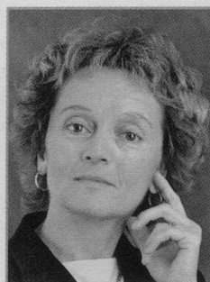
Dr. Eveline Widmer-Schlumpf, Finanzdirektorin Kanton Graubünden und Präsidentin der Finanzdirektorenkonferenz Schweiz

Die Kantone sind bereit, gewillt und in der Lage, auch die ihnen im Rahmen der NFA neu übertragenen Aufgaben verantwortungsbewusst wahrzunehmen.