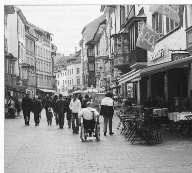
Langsam setzt sich auch in der Schweiz die Einsicht durch: Für den Umgang mit ihrer Behinderung sind die Betroffenen selber Expertinnen und Experten.

Modelle, denen der Gedanke zugrunde liegt, dass Menschen mit Behinderung selber Expertinnen und Experten sind, wenn es darum geht zu entscheiden, welche Art von Unterstützung sie wann brauchen, sind inzwischen vielerorts unbestritten. So ist die persönliche Assistenz, die in der Schweiz im Rahmen eines Pilotversuchs noch in der Erprobungsphase ist (siehe Seite 8), in anderen europäischen Ländern, aber auch in den USA ein längst anerkanntes Modell. Eines der führenden Länder in dieser Beziehung ist Schweden, wo bereits seit 1984 persönliche Assistenzmodelle funktionieren.