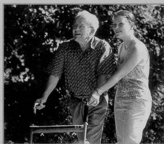
Die Gesundheits- und Fürsorgedirektion finanziert die Ausbildungsleistungen der Betriebe mit zweckgebundenen Pauschalen.

Die Gesundheits- und Fürsorgedirektion GEF finanziert die Ausbildungsleistungen der Betriebe mit zweckgebundenen Pauschalen und stellt zudem Instrumente und Hilfsmittel zur Verfügung, um den Betrieben die Ausbildungsaufgabe zu erleichtern. Die Hilfs-