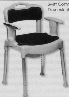
Swift Commode ist ein zerlegbarer Toilettenstuhl mit Sitzhöhenverstellung. Kann auch als Toilettenerhöhung über die Toilette gestellt oder als Duschstuhl verwendet werden.

Rückmeldungen, Anregungen und Kritik nehmen wir ebenfalls gerne entgegen: helpline@pallnetz.ch . □