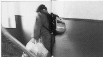
Die steigende Nachfrage nach Spitex-Dienstleistungen hält die Mitarbeiterinnen auf Trab.

(ks) «Die Spitex ist ein Pflegefall», erklärte der Schweizerische Beobachter seiner Leserschaft im August (Nr. 16/08). Begründet wurde dieses Verdikt insbesondere mit dem Personalmangel: «Die Spitex ist am Anschlag.» Auch in anderen Medien sind in letzter Zeit Artikel erschienen, die auf die Grenzen der Spitex hinwiesen und Kritik mehr oder weniger deutlich formulierten. Die Vorwürfe reichen von mangelnder Flexibilität im Kundenbereich bis hin zur Ablehnung von Einsätzen in grösserem Ausmass.