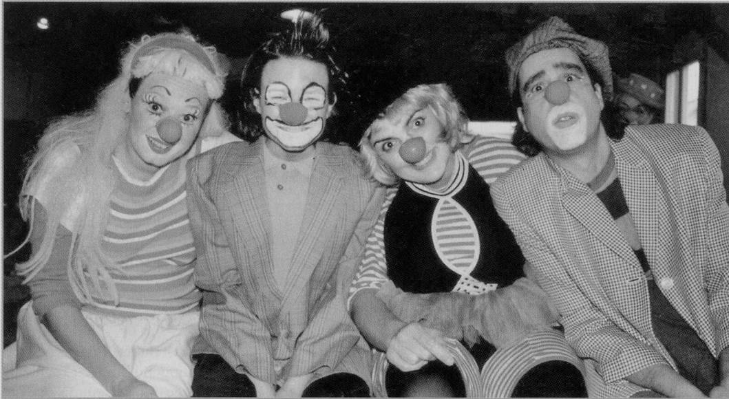
In vielen Regionen werden Fortbildungen zur Förderung des Humors im Gesundheitswesen angeboten.

Bereichen wie Pflege, Psychotherapie und Clownerie.