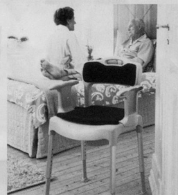
Nachtstuhl SWIFT Commode

bimeda Leichter durch den Alltag Produkte für mehr Lebensqualität