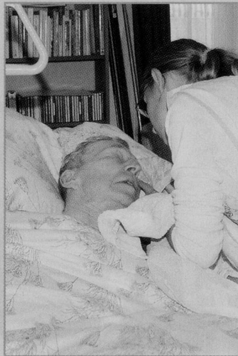
An der DV des Spitex Verbandes Kanton Schaffhausen wurden Tätigkeit und Ziele des Palliative Care Netzwerkes vorgestellt.