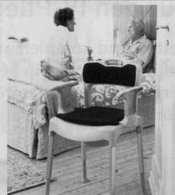
Nachtsstuhl SWIFT Commode

bimeda® Leichter durch den Alltag Produkte für mehr Lebensqualität