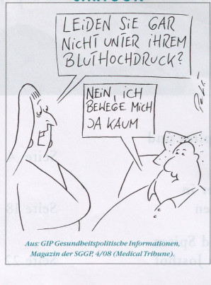
Aus: GIP Gesundheitspolitische Informationen, Magazin der SGGP, 4/08 (Medical Tribune).