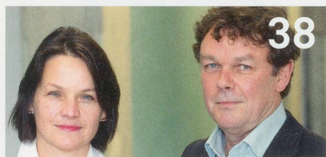
Spitex-Fusionen in der Stadt Zürich