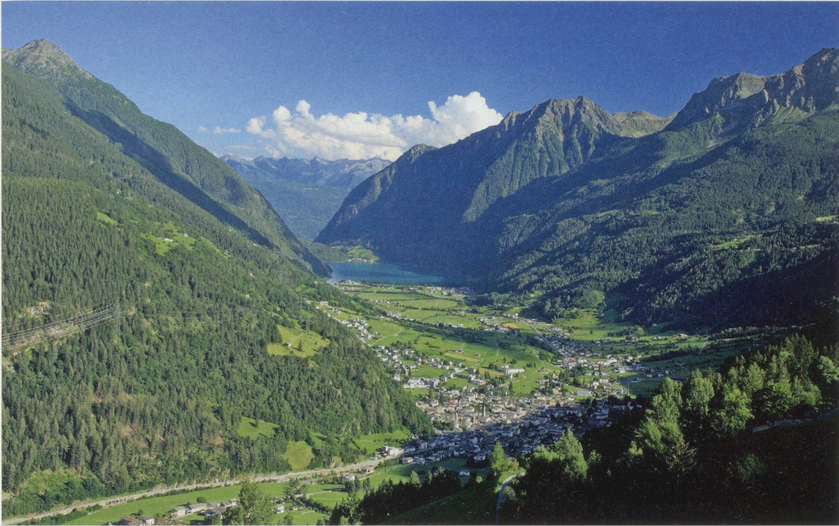
Das Spitex-Projekt «La Girandola» im Valposchiavo entlastet Angehörige von demenzkranken Menschen. Das «Windrad» bringt «un soffio di sollievo» in dieses Bündner Südtal.