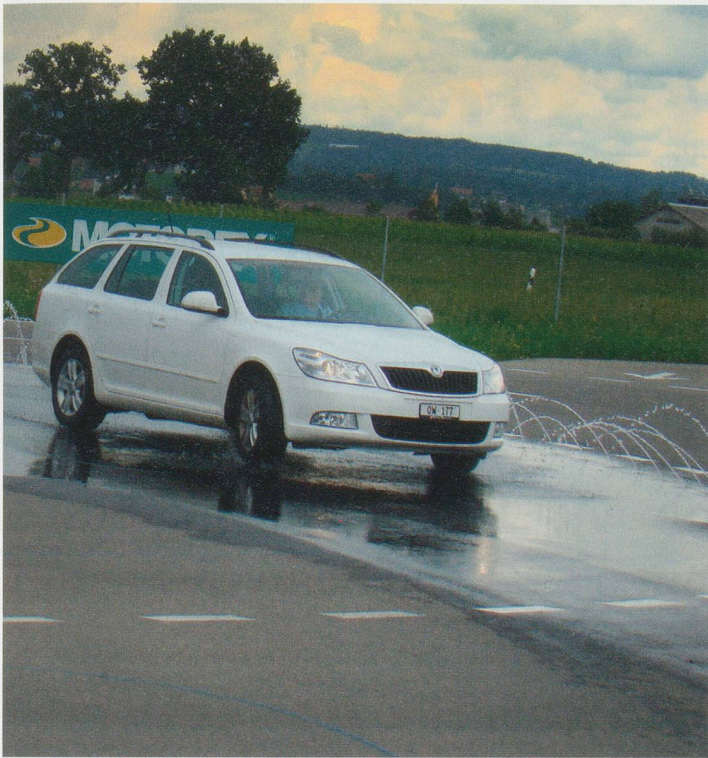
Bilder: Niklaus von Deschwanden