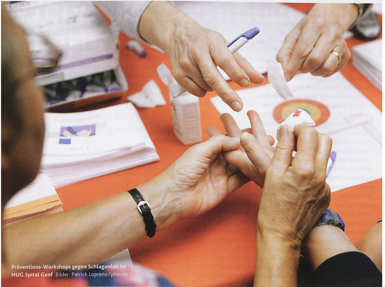
Präventions-Workshops gegen Schlaganfall im HUG Spital Genf

Jährlich erleiden rund 16 000 Menschen in der Schweiz einen Schlaganfall. Nach Herzerkrankungen und Krebs stellt der Schlaganfall die dritthäufigste Todesursache dar. Und er ist die häufigste Ursache für eine nicht unfallbedingte Behinderung bei Erwachsenen. Fachleute erwarten, dass diese Zahl aufgrund der höheren Lebenserwartung ansteigen wird.