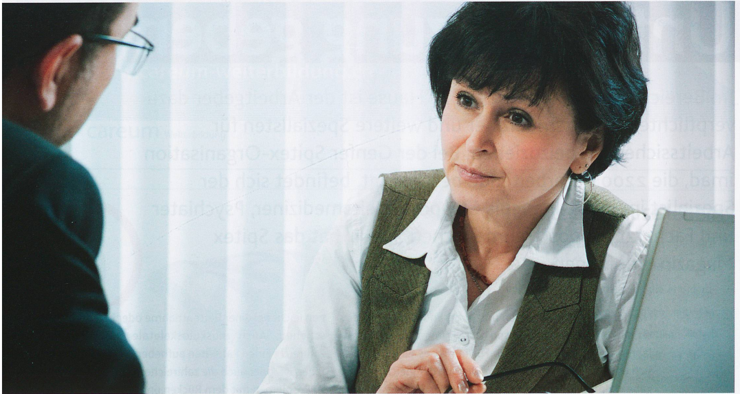
Die Genfer SpiteX-Organisation, imad, fördert mit einem breit angelegten Projekt die Gesundheit aller Mitarbeitenden innerhalb der Institution.

Auch die Mitarbeitenden selbst sind gefragt, wenn es um Verbesserungen am Arbeitsplatz oder bei der Ausrüstung geht. Auf ihre Initiative konnte das Gewicht der Rucksäcke, welche die Mitarbeitenden tragen, in den letzten Jahren erheblich verringert werden.