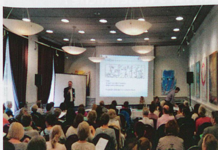
80 Interessenten am Spitex-Tag 2016

Auf enormes Interesse stiess unser Spitex-Tag 2016 in Zürich. Über 80 Personen aus 60 Spitex-Betrieben nahmen daran teil.